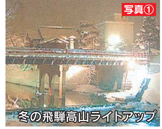
冬の飛騨高山ライトアップ