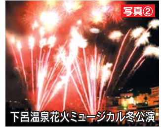
下呂温泉花火ミュージカル冬公演