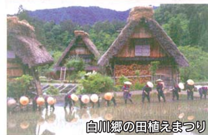
白川郷の田植えまつり